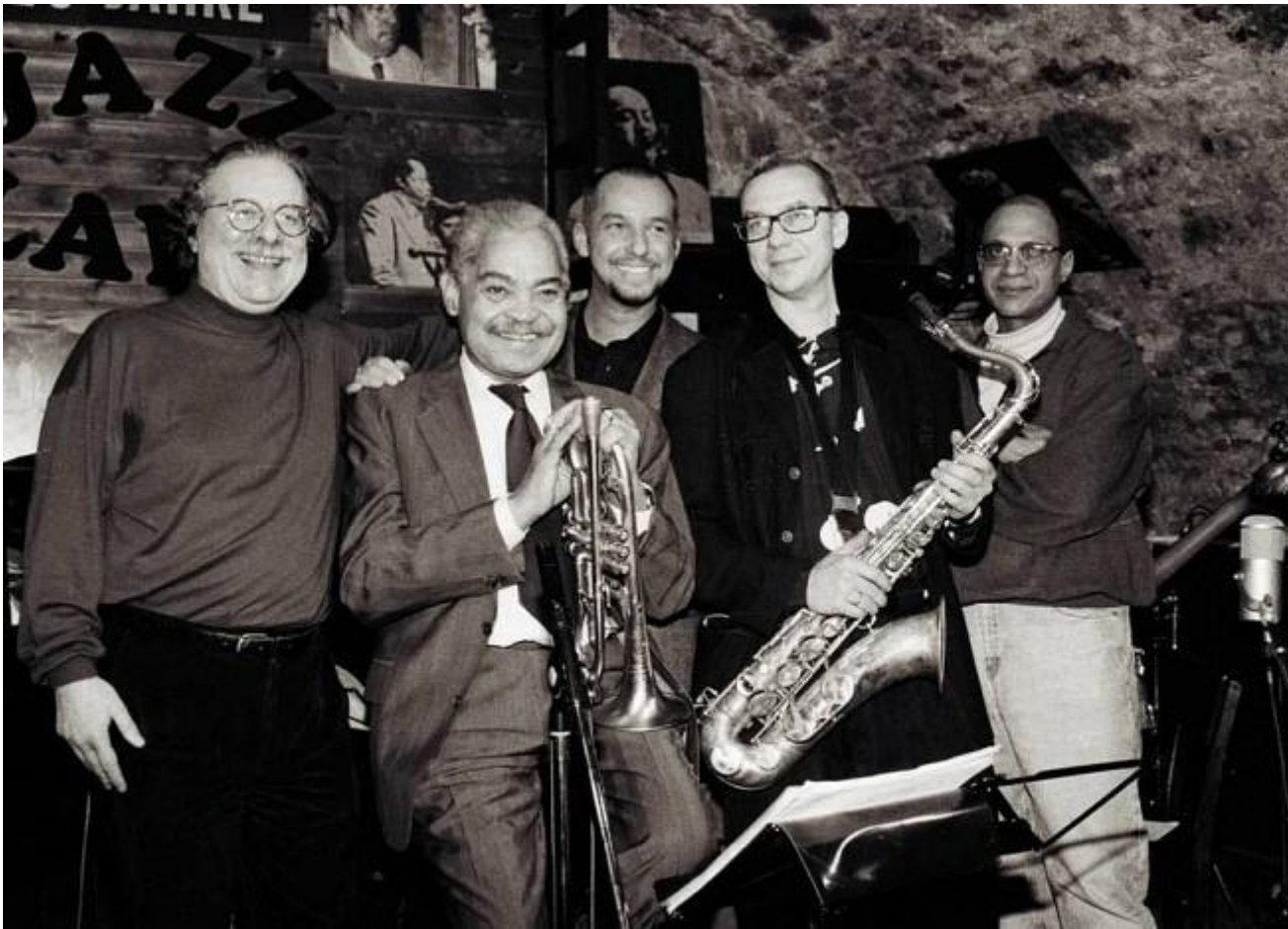
v.l.n.r.: Fritz Pauer, Art Farmer, Mario Gonzi, Harry Sokal, Paolo Cardoso (1997 im Wiener Jazzland).